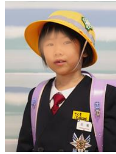
友達たくさんつくりたい です