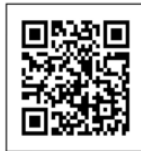
QRコードでインストール画面へ

※結ネットのQRコードを掲載してありますので、是非アクセスして利用登録をお願いします。