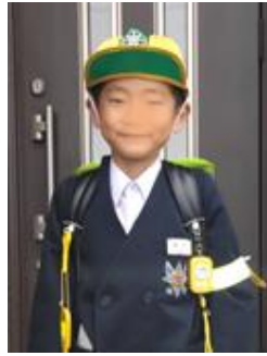
ひらがなの読み書きです