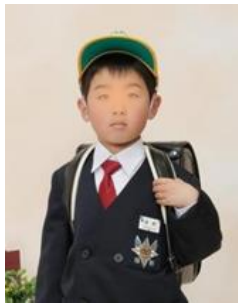
さんすうをがんばりたい