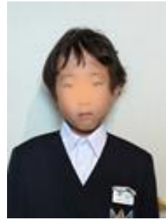
友だちをつくる事を頑張 ります