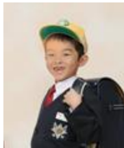
たくさん本をよめるよ うにがんばりたい