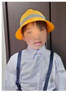
宿題をがんばります