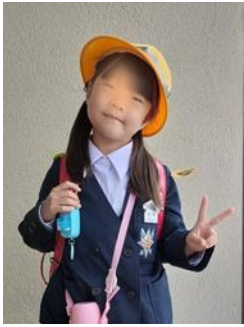
漢字をきれいにかけるよ うになりたいです