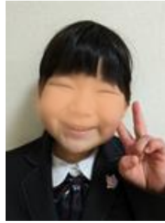
さんすうをがんばりたい です